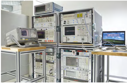
Mobile Racks für Vor-Ort-Einsätze